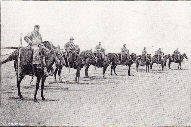
Coxyde. — Pêcheurs de crevettes

Il y existait autrefois une grande abbaye dite des Dunes, qui fut fondée, en 1107, par Ligérius. Recouverte par la mer au moyen âge, elle fut reconstruite en un lieu mieux protégé, sous l'abbatiat de Nicolas de Bailleul, en 1237. L'abbaye bénédictine fut, au XII e s., la plus florissante de l'ordre; elle s'affilia, en 1138, à l'ordre de Cîteaux et subit directement l'action de saint Bernard. Robert de Bruges ou de Gruuthuuse devint abbé des Dunes; ayant remplacé saint Bernard à la tête du monastère de Clairvaux, Robert de Bruges délégué en qualité d'abbé aux Dunes le neveu de Thierry d'Alsace, Alberon, qui ne présida guère aux destinées de cette institution et qui fit place à Idesbald, III e abbé des Dunes.